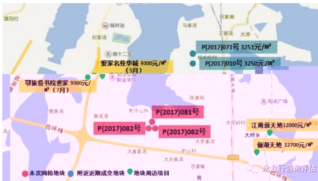
附表：今日土拍成交情况